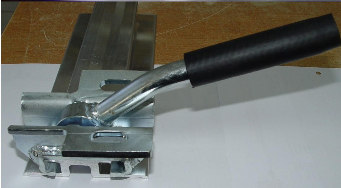
Kloben mit Lochbohrung für Zurrgurte, Gummispanner (Leergut) Mit Gummischlauch-Griff, gewebeverstärkt. Schrägere Hebelstellung, zum besseren Andruck. Weniger störend, wenn mal kein Rolli da ist.